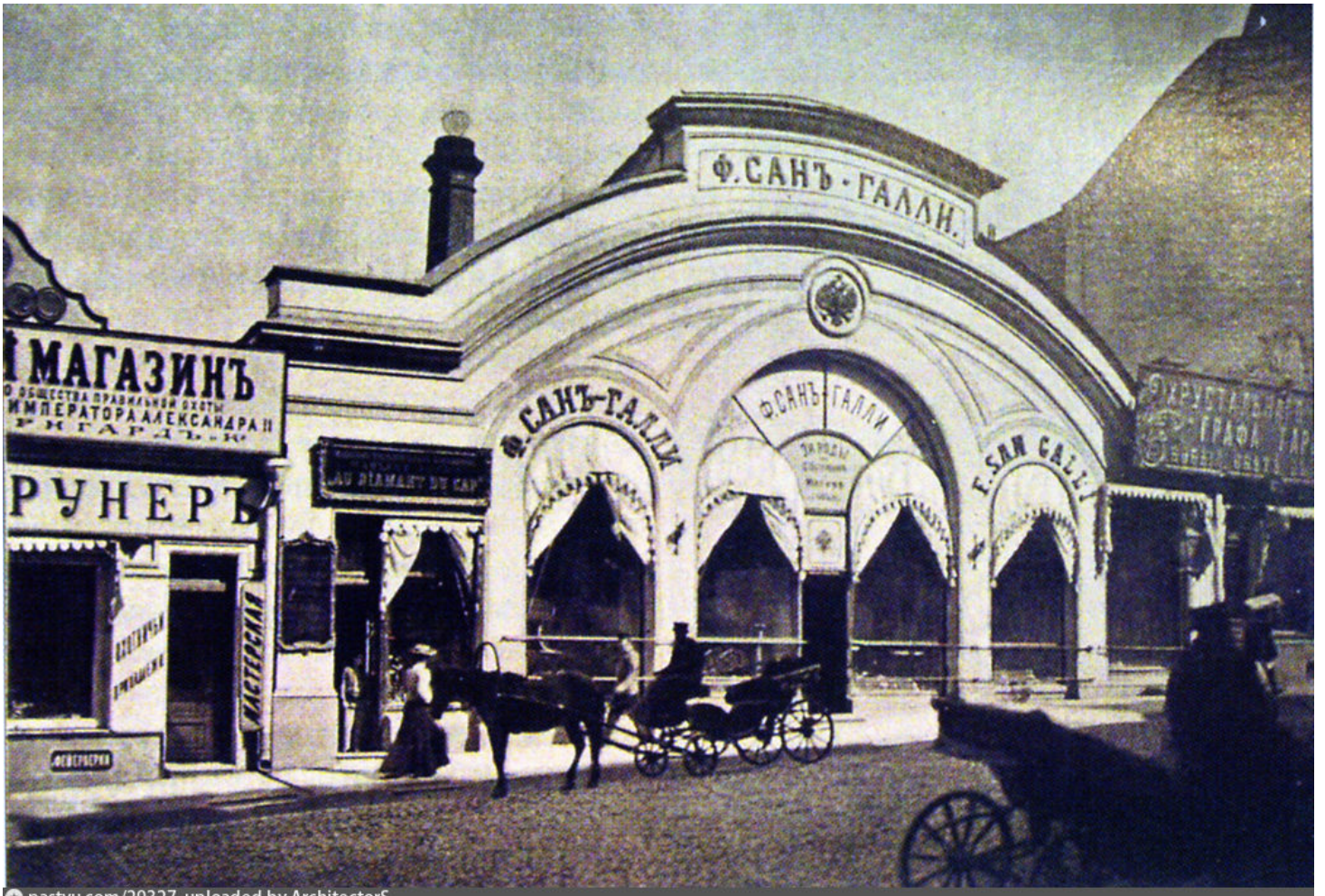
pastvu.com/29327 uploaded by ArchitectorS